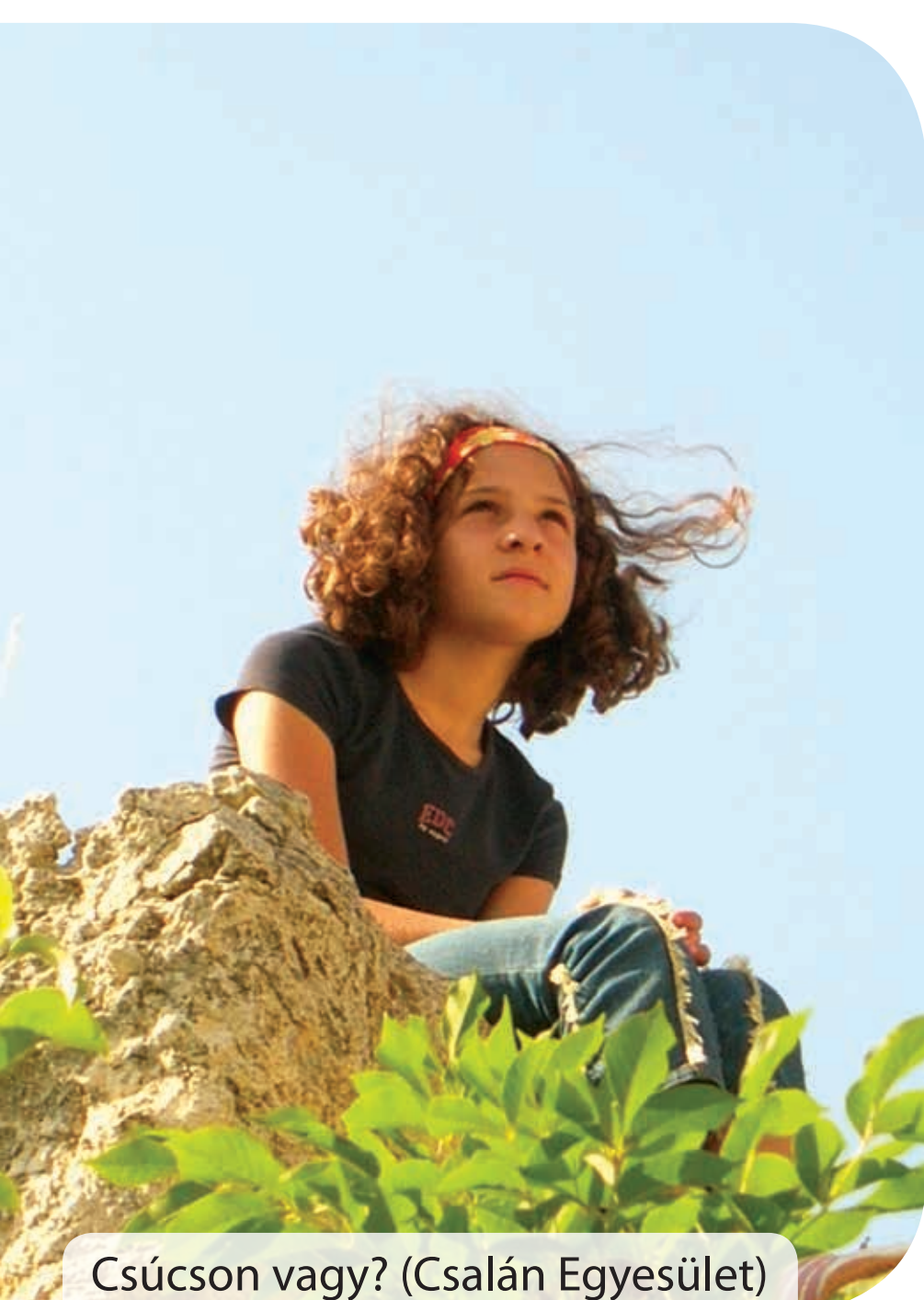
Csúcson vagy? (Csalán Egyesület)