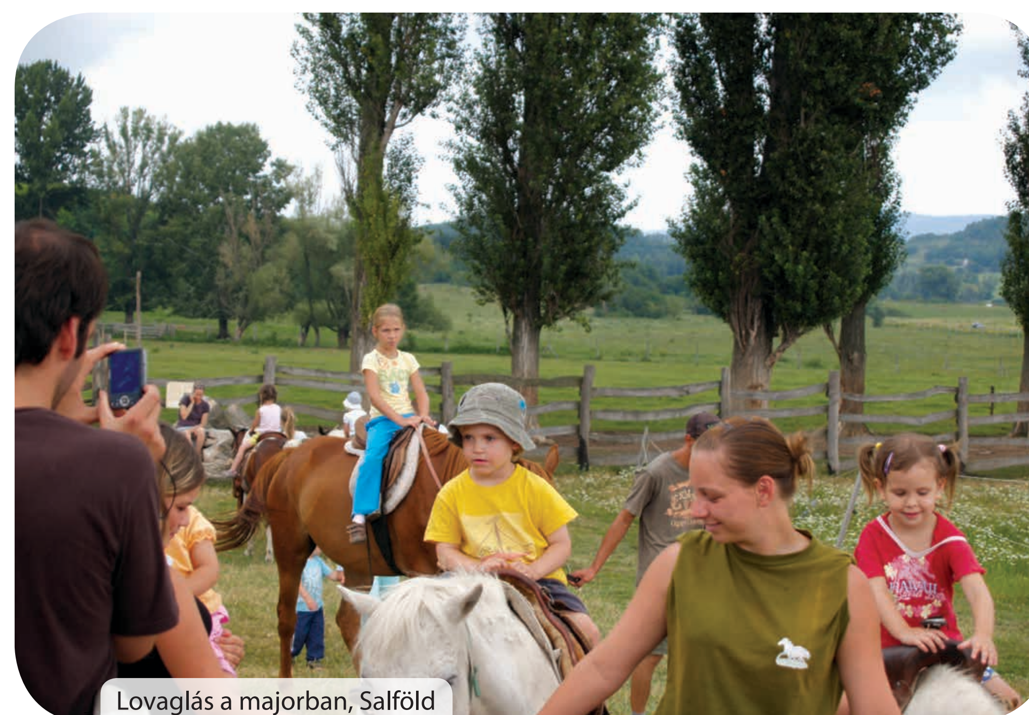
Lovaglás a majorban, Salföld