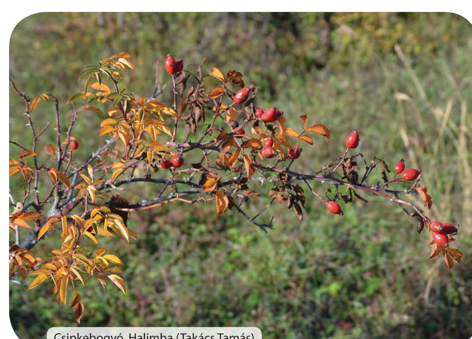
Csipkebogyó, Halimba (Takács Tamás)