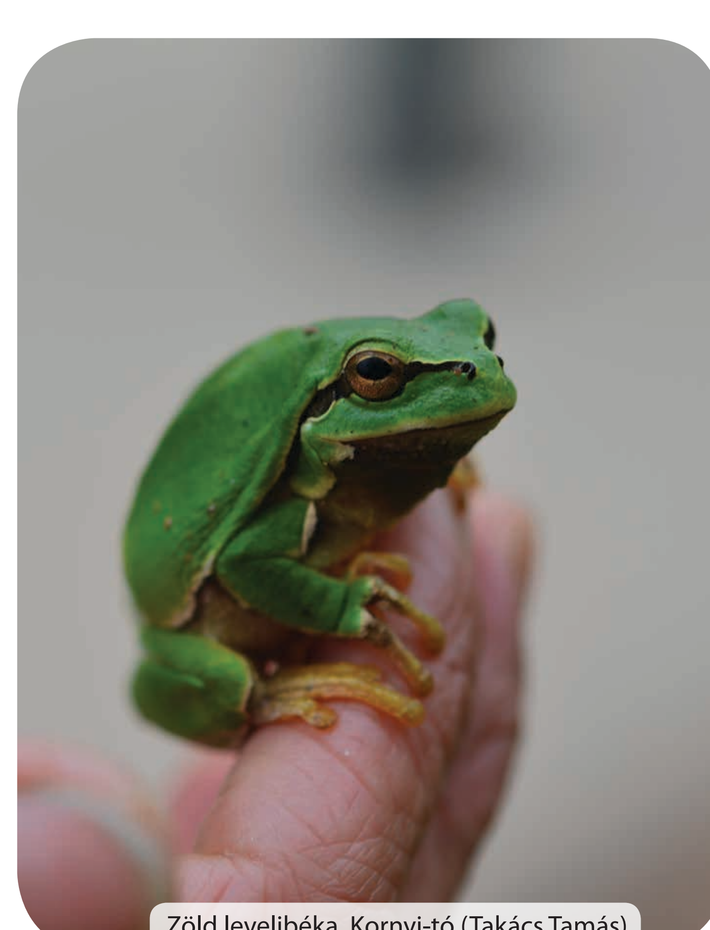
Zöld levelibéka, Kornyi-tó (Takács Tamás)