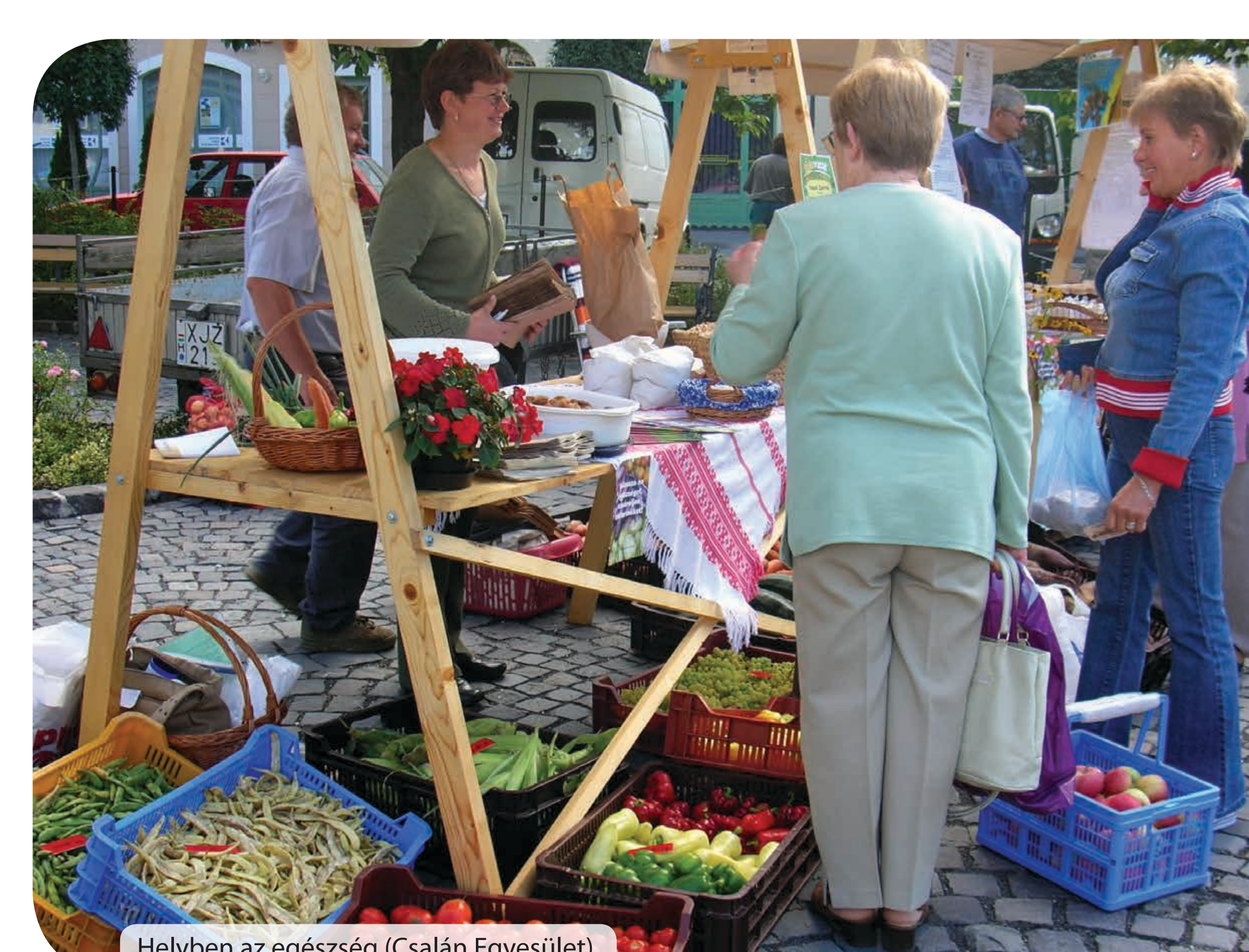
Helyben az egészség (Csalán Egyesület)