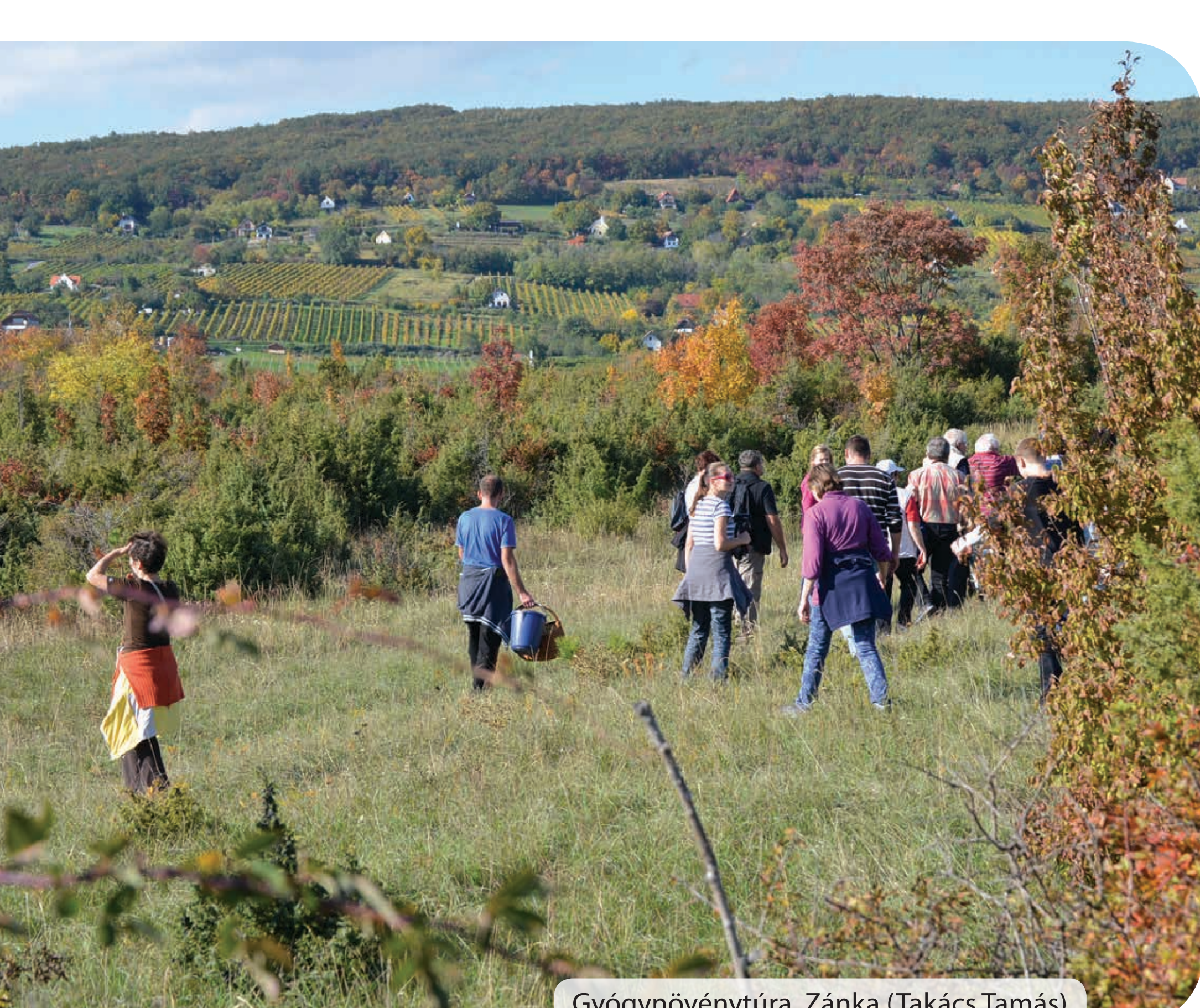
Gyógynövénytura, Zánka (Takács Tamás)