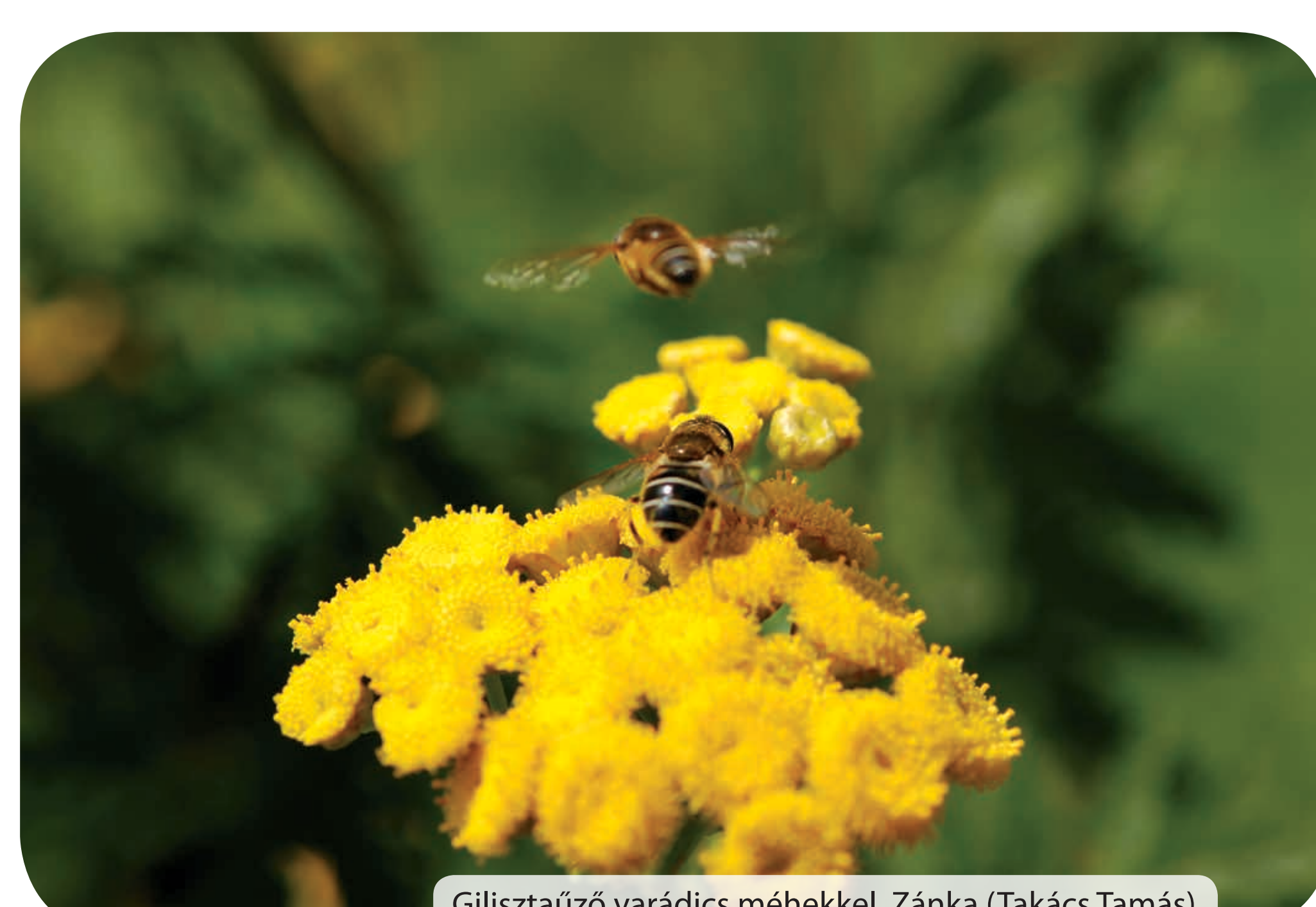
Giliszaűző varádics méhekkel, Zánka (Takács Tamás)