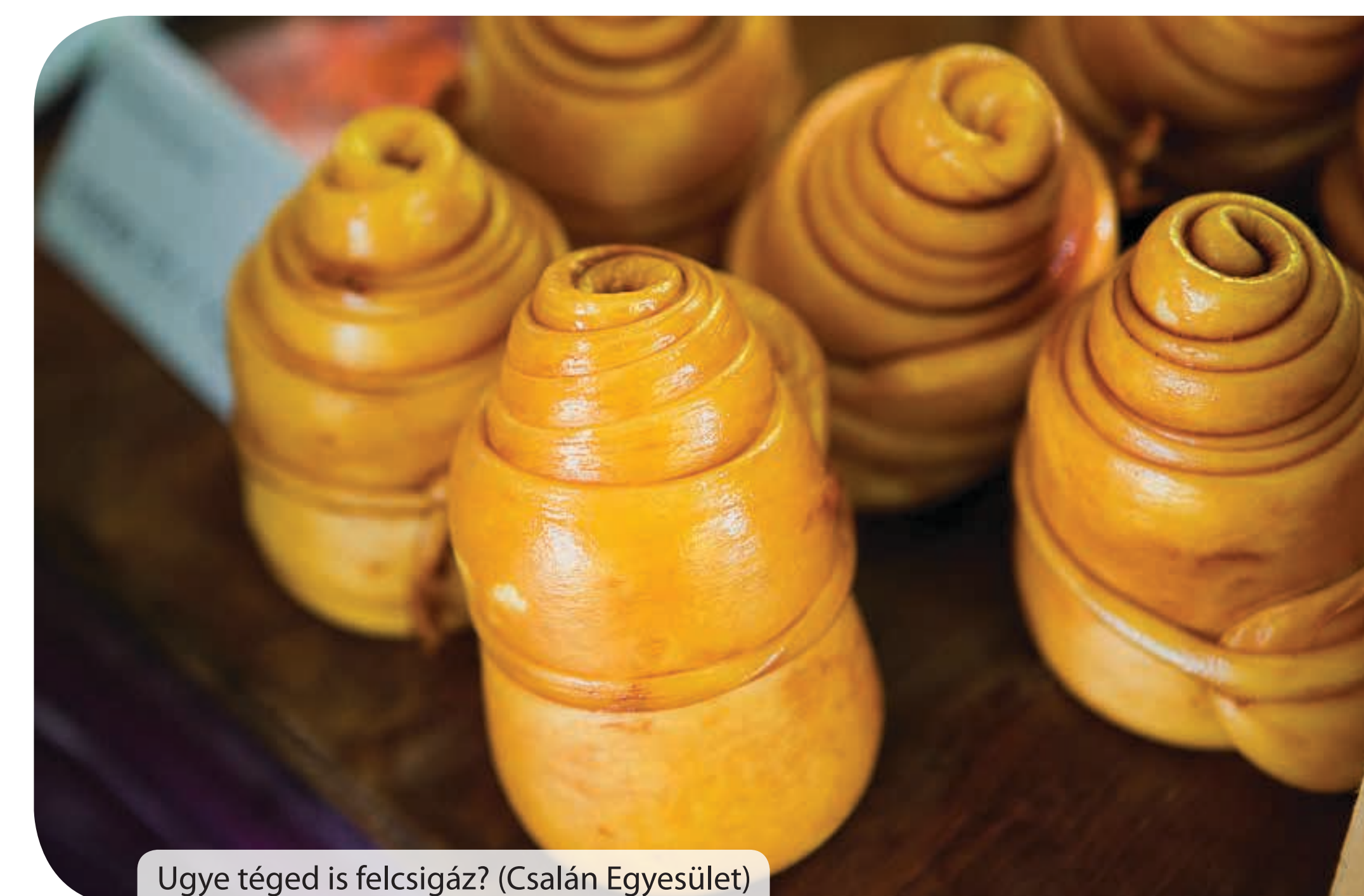
Ugye téged is felcsigáz? (Csalán Egyesület)