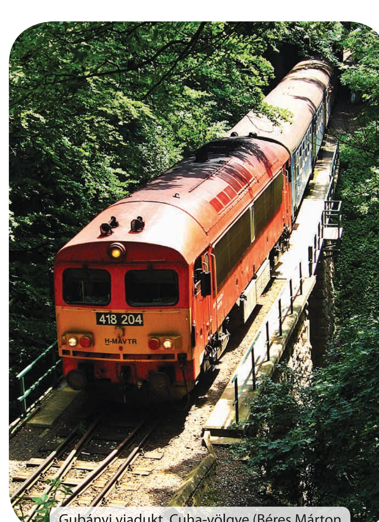
Gubányi viadukt, Cuha-völgye (Béres Márton)